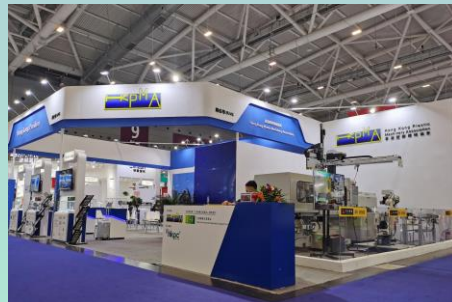
*這個展位的最終位置、大小、設計等事宜將以香港塑膠機械協會最後確認作依據，如對項目安排有任何爭議，香港塑膠機械協會保留最終決定權。